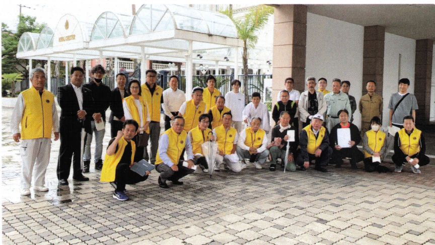
今期最後の早朝例会でロイヤルチェスター佐賀周辺の清掃活動を行いました。