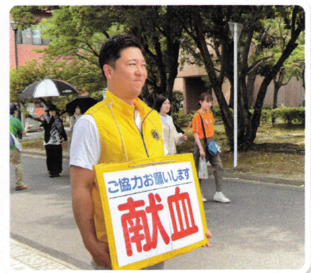
AM10:30~12:00 13:30~16:30 佐賀大学鍋島キャンパスにて献血を実施致しました。