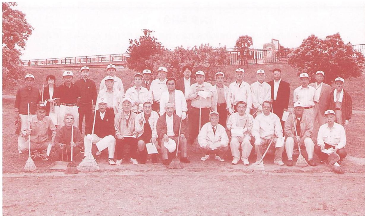
『諸富・昇開橋展望公園』を清掃奉仕するライオンズ