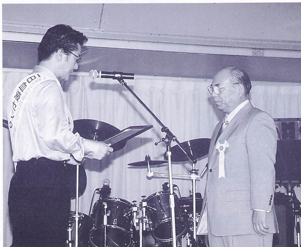
一日所長、白竜氏(伊万里市出身、歌手・俳優)より受ける