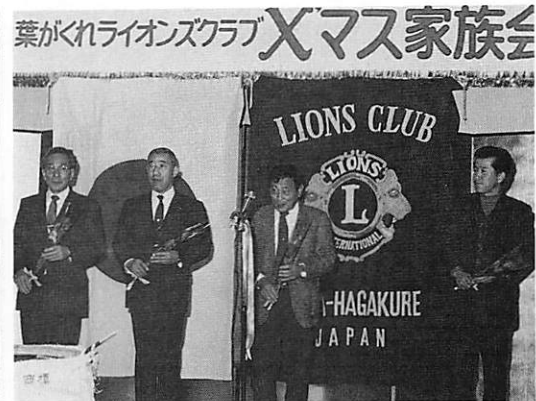
12月の誕生日の各ライオンのみなさん