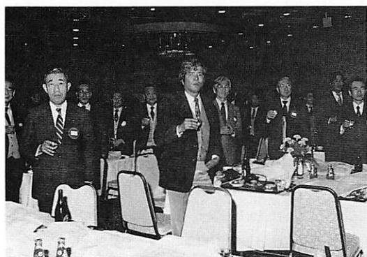
葉がくれのメンバー カンパイ