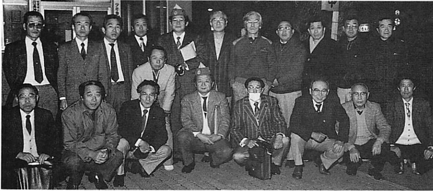
佐嘉神社派出所前—出発前に