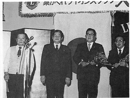
前会長L江島前幹事L深町達へ現会長幹事より花束贈呈