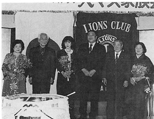
12月の結婚記念日の各ライオン及ネスのみなさん