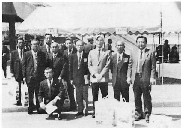
出席者のメンバー会場前で