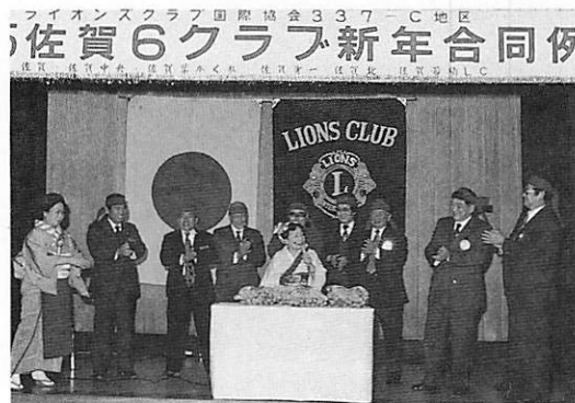
アトラクションでバナナのタタキ売り