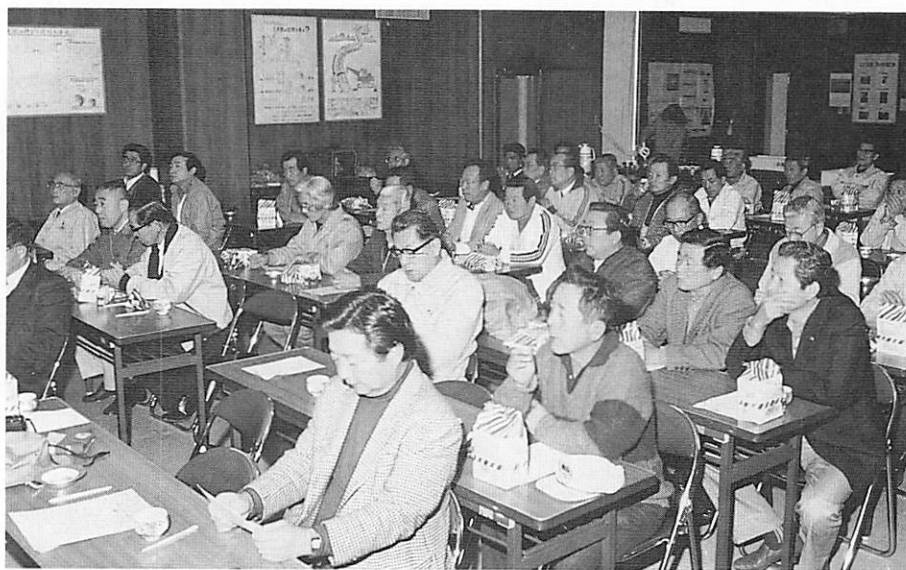
朝食はパンとミルク