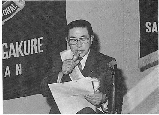
会計の中間報告 L太田