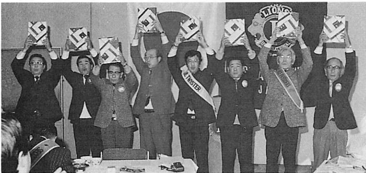
1月度の誕生者のみなさん