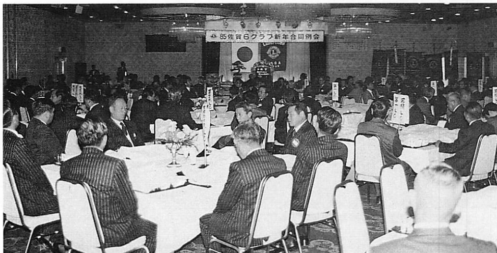
新年の年始例会では400人近い会員の例会で始まる