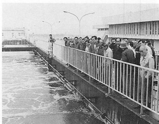
雨天であったが最後までご協力を頂きました