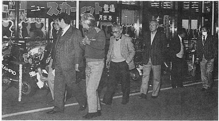
夜間の中心街パトロール