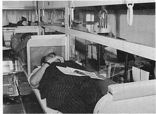
各ライオンありがとうございます。ご健康の証明!!