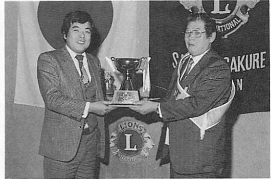
葉がくれコンペ優勝 L吉本