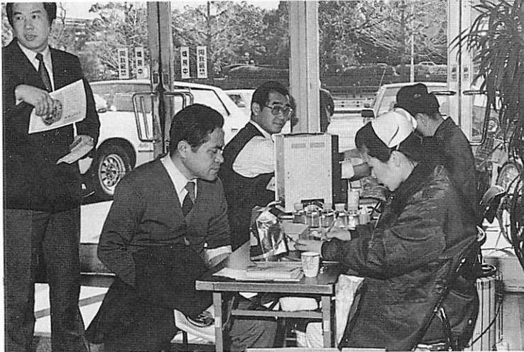
佐賀商工会館で実施して一般市民の参加も多く感謝しています