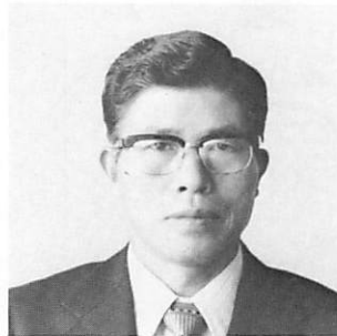
L 西 村