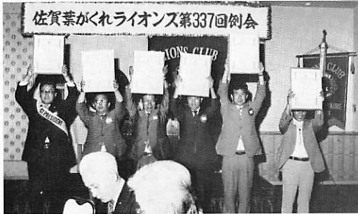
前執行部への感謝状贈呈