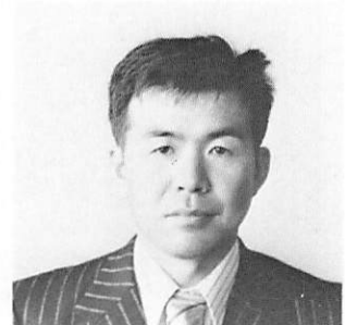
L 野 口