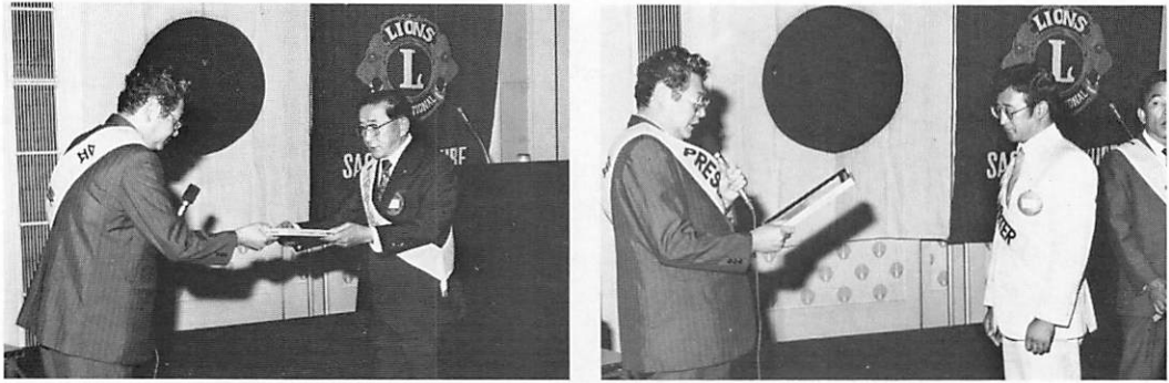
今年の各執行部へ委嘱状の伝達