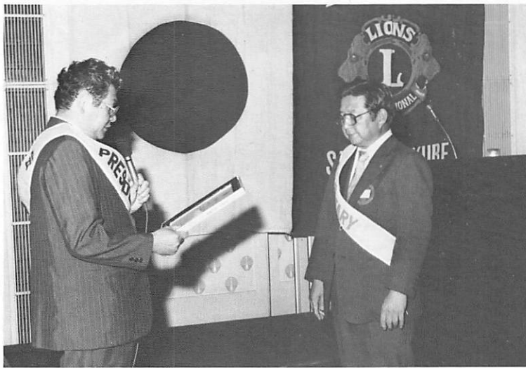
松井幹事よろしく