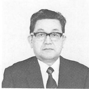
L 江 島