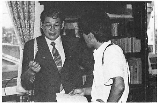
佐賀新聞社記者と話し合い