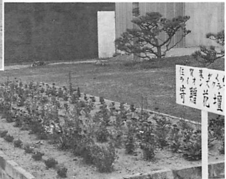
59年3月22日 佐賀少年刑務所に花の苗300本贈呈するの花壇が実をむすんだ風景