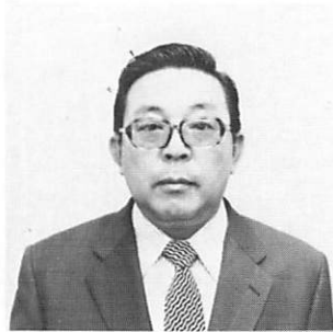
L 深 町