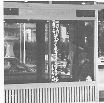
今回は佐嘉神社記念館を利用しました