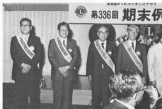
前会長、会長、副会長