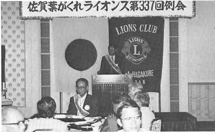
山田会長のあいさつ