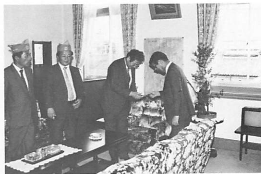
所長さんから現在の受刑者の内容など説明をきく