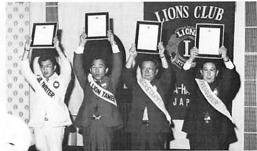
今期執行部への委嘱状伝達