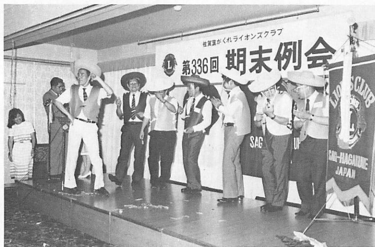
このメンバーでガンバります。どうかよろしく。