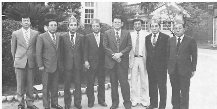
今後も少年刑務所へは訪問はつづけたい