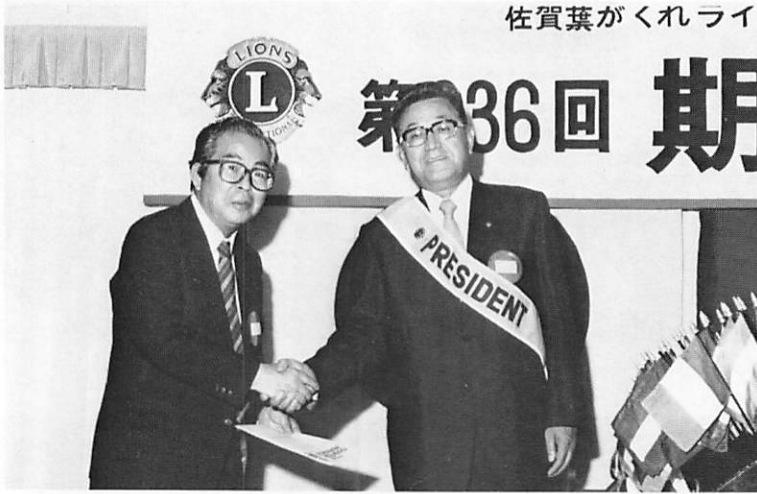
日赤より献血に対しての感謝状