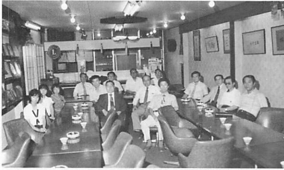
北海道青少年Y E派遣の第1回オリエンテーション