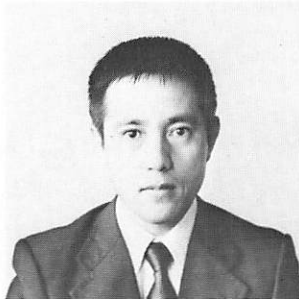
L 森 永