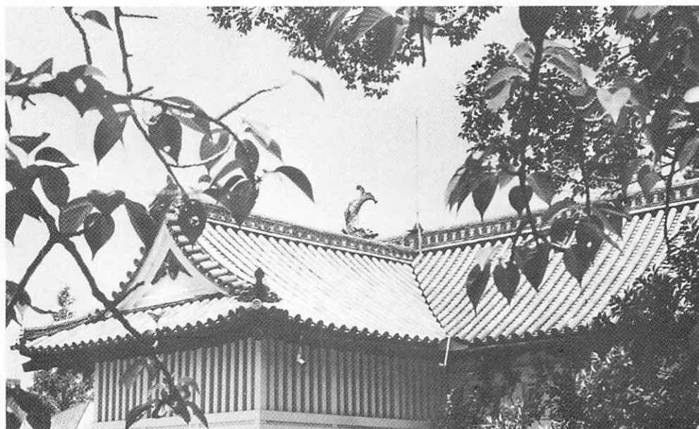
佐 嘉 城

佐嘉城は慶長13年に総普請が始まり慶長16年に完成した。本丸、二の丸、三の丸、西の丸からなり五層の天守閣。城の四囲は幅約75mの堀がめぐらせてあり全長2,300m位に及び、深さは2m70位だった。