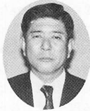
4 R Y E 委員